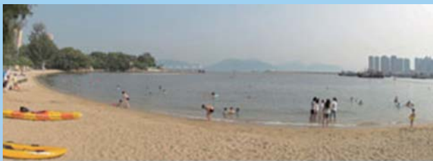
拥有蓝天碧海的青山湾泳滩吸引泳客前来畅泳

➤ 自二零零五年重开以来,青山湾泳滩的水质继续有所改善,而这情况可从泳滩每周等级反映出来。